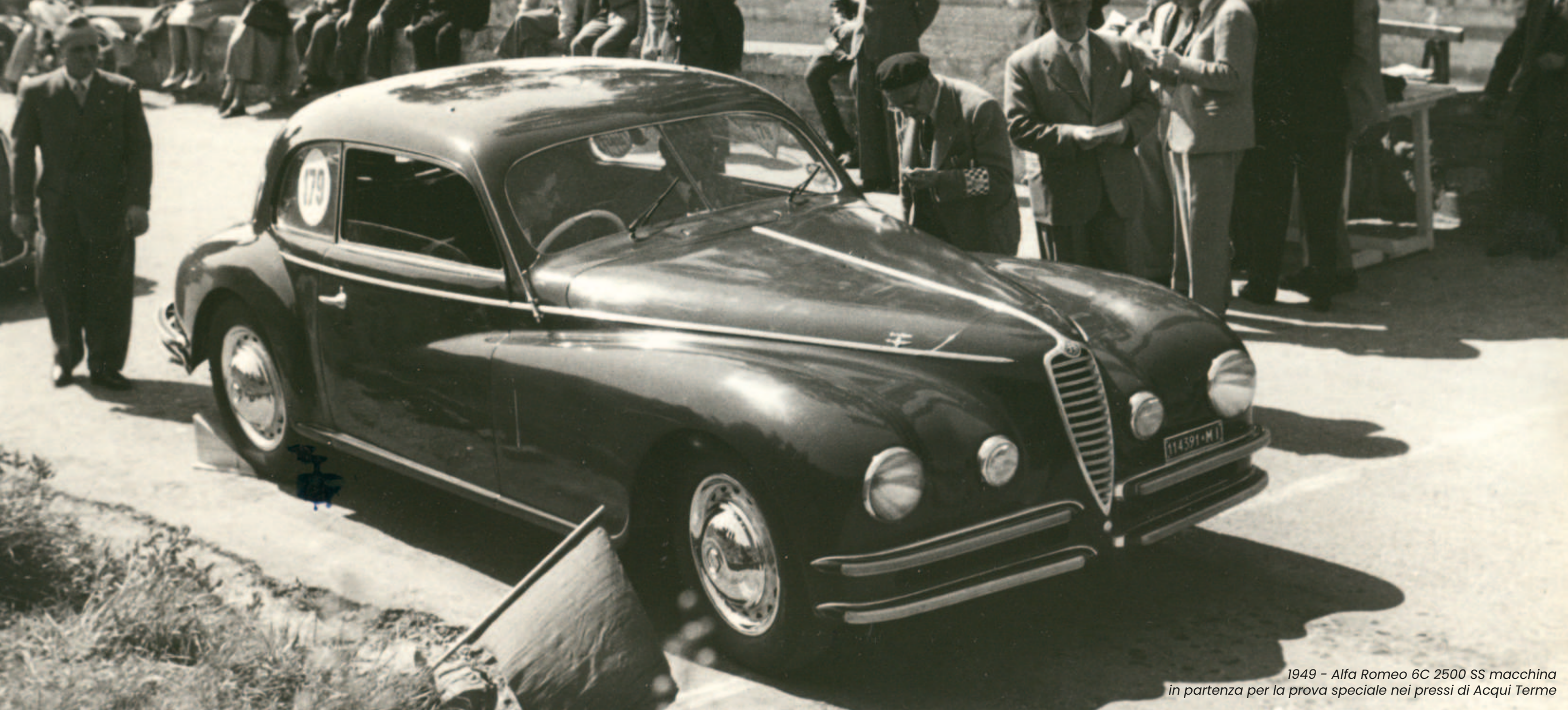
1949 - Alfa Romeo 6C 2500 SS macchina in partenza per la prova speciale nei pressi di Acqui Terme